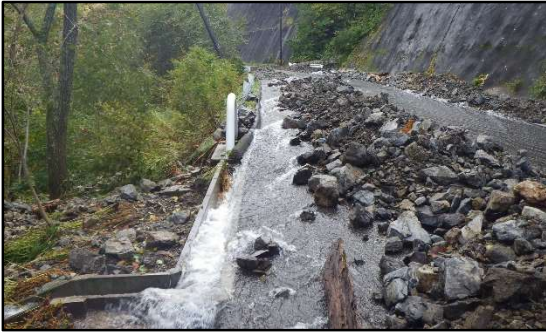
林道笛岩・檜枝岐線