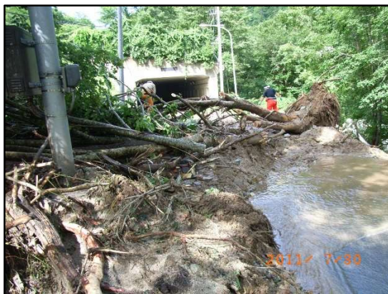
下大戸沢スノーシェッド付近