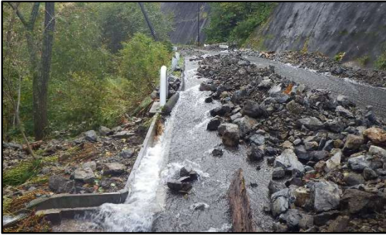
林道笛岩・檜枝岐線